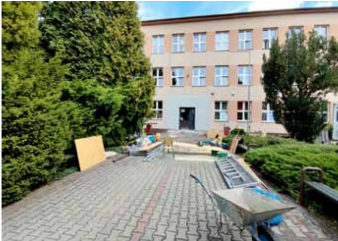
Modernizacja szkoły w Bestwinie