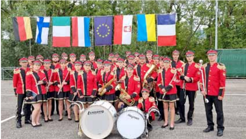
Orkiestra Dęta Gminy Bestwina z siedzibą w Kaniowie

artystów z całego kontynentu, w tym Orkiestra Dęta Gminy Bestwina z Siedzibą w Kaniowie . Przypomnijmy, że koncertowanie w kraju Napoleona to dla muzyków z naszej gminy swoista tradycja – byli już na Festiwalu Cytryn i Pomarańczy w Menton i na karnawale w Nicei.