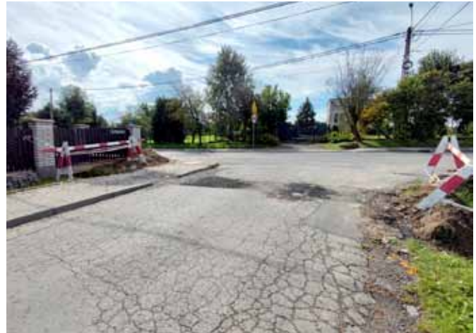
Skrzyżowanie ul. Sportowej i Dworkowej