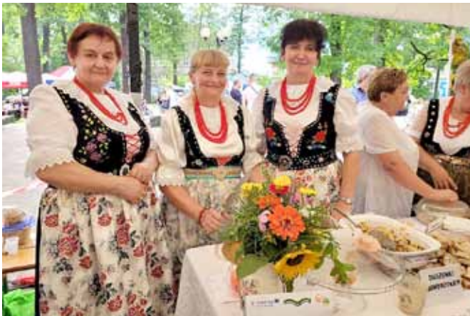
Reprezentacja KGW Janowice