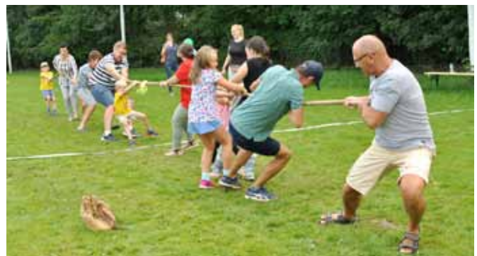
Rodzinne przeciąganie liny