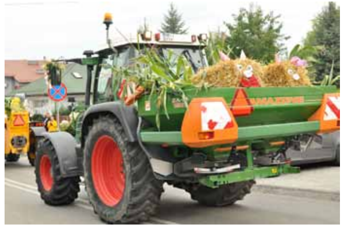
Przejazd pomysłowo udekorowanych maszyn rolniczych