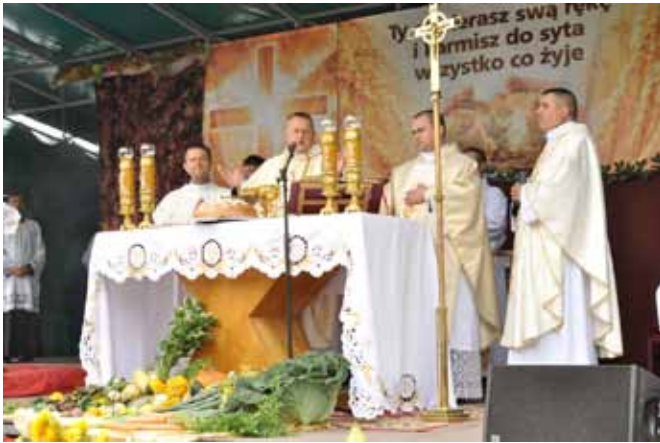
Msza św. na polowym ołtarzu