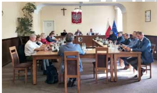
Obrady XLVII Sesji Rady Gminy Bestwina