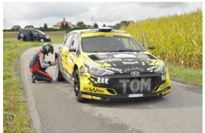
Przygotowanie do rajdu – punkt startowy w Bestwince