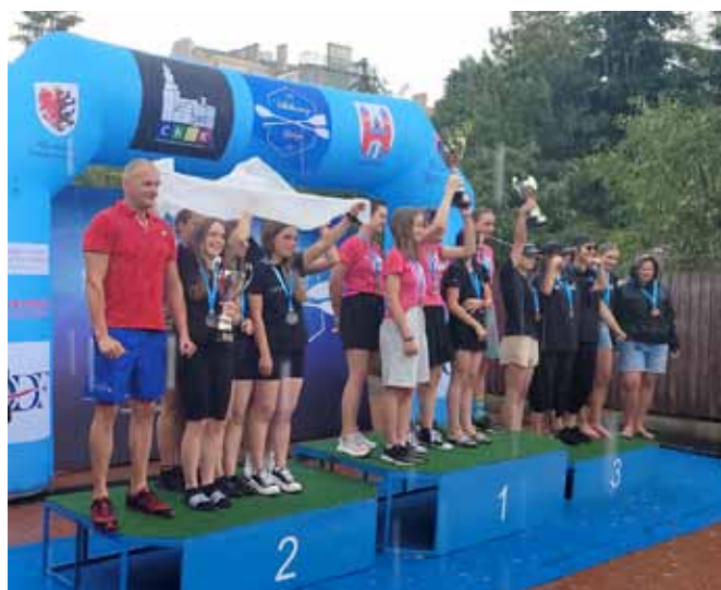
Kobiety UKS „Set” Kaniów U21 ze złotym medalem