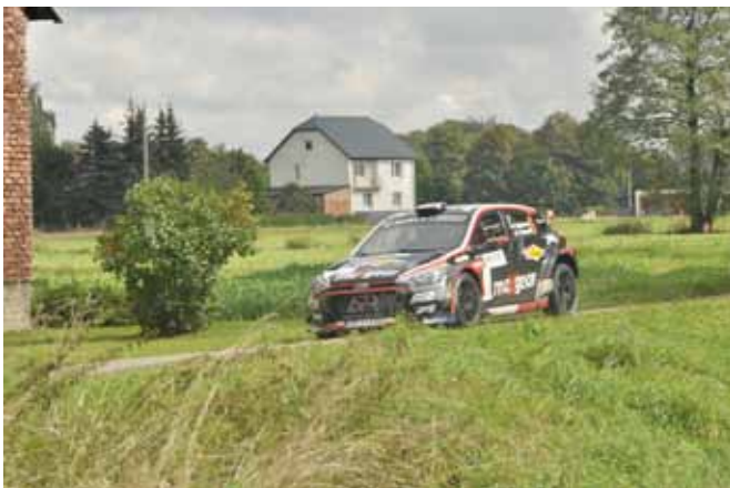
Przejazd ulicami gminy Bestwina

Szczegóły i wyniki: http://rajdslaska.pl/