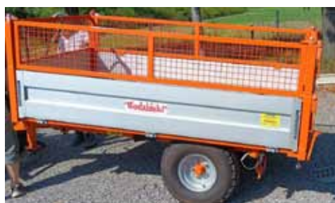
Nowy nabytek Stowarzyszenia Wędkarskiego „Kaniowski Karp Królewski”

Gmina Bestwina wraz ze Stowarzyszeniem Wędkarskim „Kaniowski Karp Królewski” im. A. Gascha wzbogaciły się o nowy sprzęt, który pomoże pasjonatom łowienia i hodowli ryb w realizacji statutowych zadań. Jest to przyczepa rolnicza o wielofunkcyjnym zastosowaniu. Stowarzyszenie w ciągu roku organizuje wiele inicjatyw: szereg zawodów wędkarskich, akcje sprzątnięcia i zarybiania akwenów, wykaszania ich brzegów, pielęgnacji zieleni, jak również jest współorganizatorem Święta Karpia Polskiego w Kaniowie. Przyczepa z pewnością ułatwi transport różnorodnych materiałów, a jej zakup został sfinansowany ze środków Urzędu Gminy Bestwina, Starostwa Powiatowego w Bielsku – Białej i samego Stowarzyszenia Wędkarskiego.