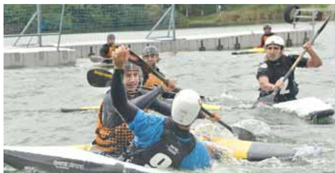
Pojedynek na wodzie

Akweny przy ul. Malinowej sprzyjały gospodarzom – dwa złota i dwa brązy to dorobek naszych drużyn w Międzynarodowym Turnieju Kajak Polo i Międzywojewódzkich Mistrzostwach Młodzików o Puchar Wójta Gminy Bestwina . Udział wzięły bardzo dobrze przygotowane ekipy z całej Polski i spoza granic kraju – widzowie oglądali poczynania Czechów, Litwinów, gościnnie także zawodników z Finlandii. Oprócz Uczniowskiego Klubu Sportowego „Set” Kaniów wkład w organizację imprezy wnieśli