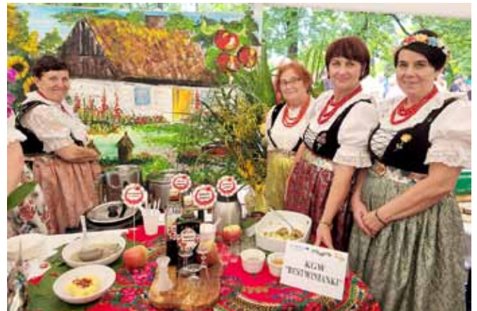
Stoisko KGW „Bestwinianki”