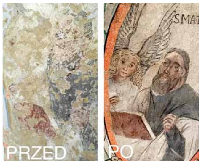
Fragment polichromii – św. Mateusz

Śląski Wojewódzki Konserwator Zabytków 23 sierpnia podzielił się wiadomością, że w kościele Wniebowzięcia NMP w Be-