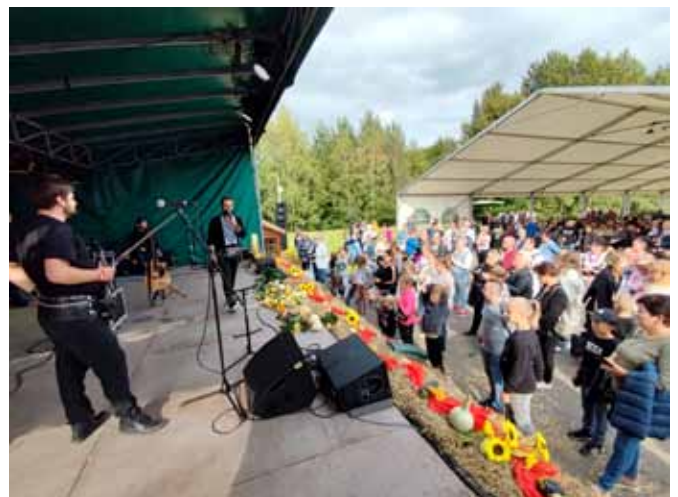
Koncert Pawła Gołdeckiego z zespołem