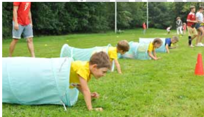
Tor przeszkód dla dzieci