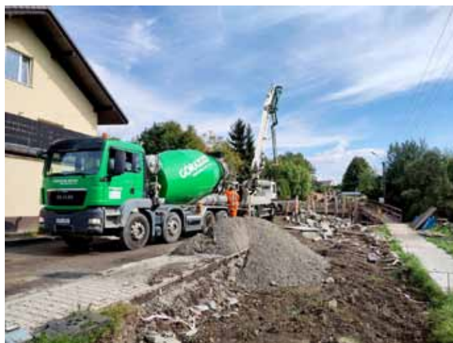
Bestwinka – budowa mostu nad Łękawką