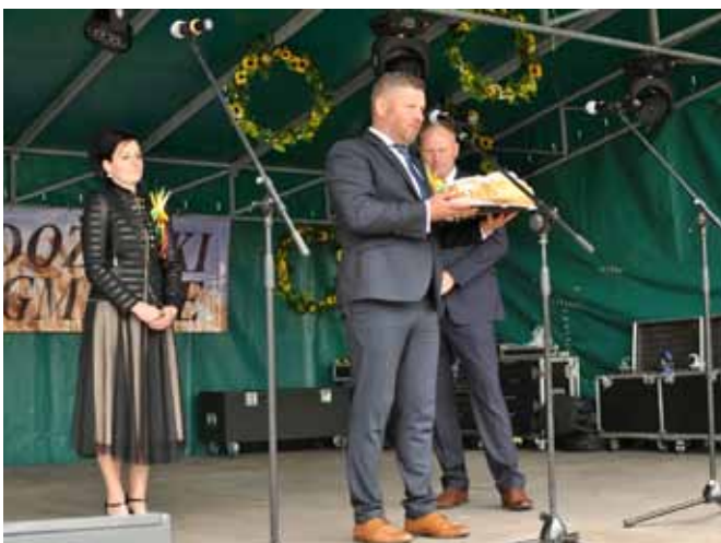
Przekazanie chleba – przemówienie wójta