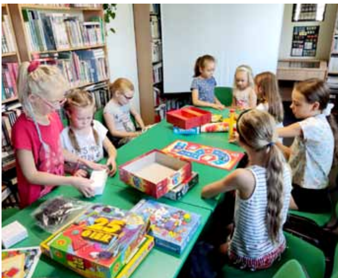
Gry planszowe – zajęcia w Kaniowie