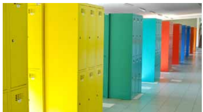
Nowa szatnia szkolna – ZSP Bestwina